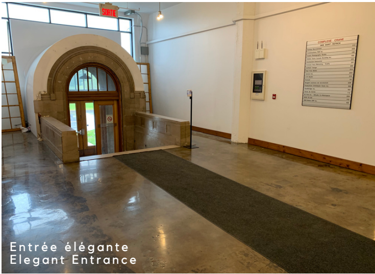
Entrée élégante Elegant Entrance