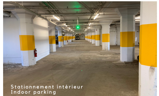
Stationnement intérieur Indoor parking

Easy access to Highways 20 & 720 Public Transportation Bus #101 & Métro Charlevoix Close to Downtown