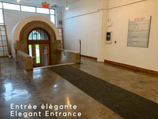
Entrée élégante Elegant Entrance