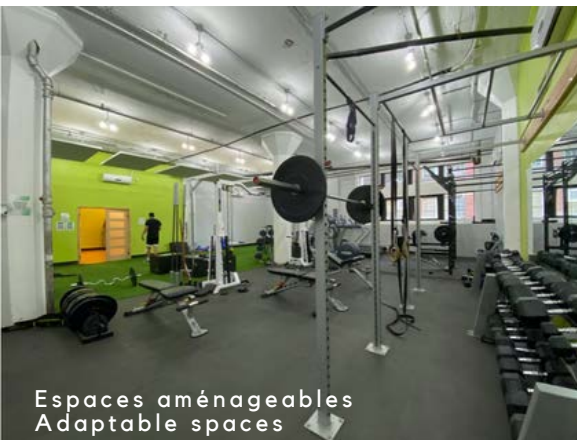
Espaces aménageables Adaptable spaces