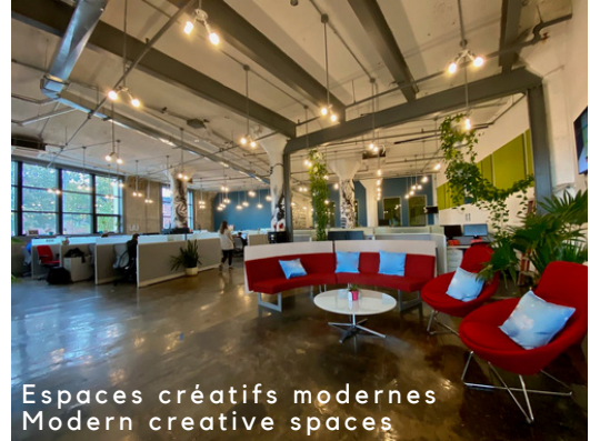
Espaces créatifs modernes Modern creative spaces