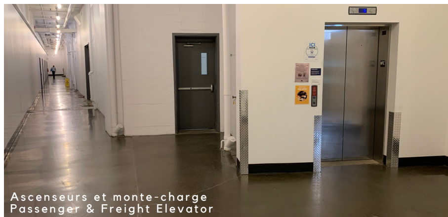
Ascenseurs et monte-charge Passenger & Freight Elevator