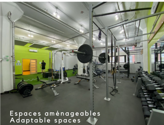
Espaces aménageables Adaptable spaces