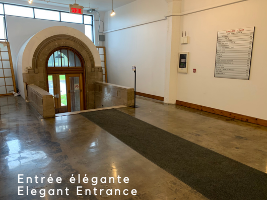
Entrée élégante Elegant Entrance