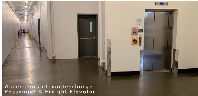
Ascenseurs et monte-charge Passenger & Freight Elevator