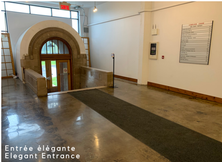
Entrée élégante Elegant Entrance