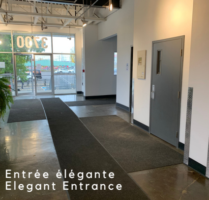
Entrée élégante Elegant Entrance