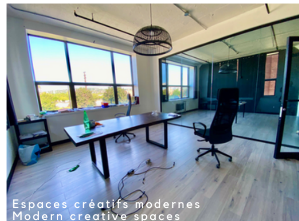
Espaces créatifs modernes Modern creative spaces