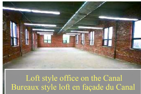
Loft style office on the Canal Bureaux style loft en façade du Canal