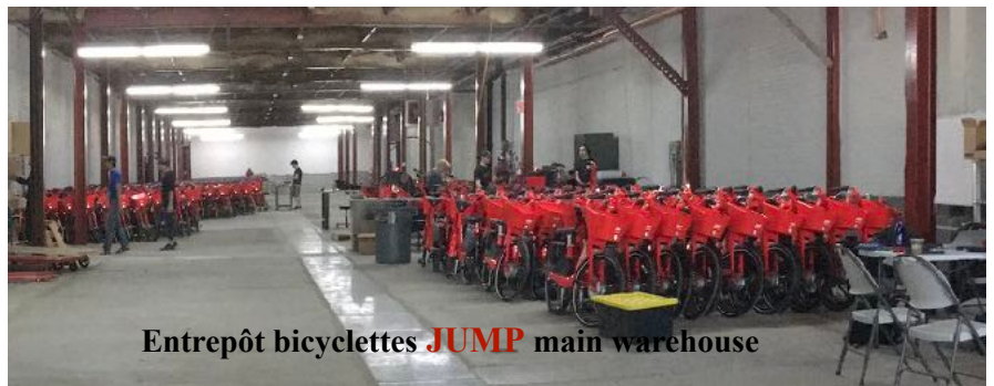
Entrepôt bicyclettes JUMP main warehouse

Les informations ci-incluses proviennent de sources que nous jugeons fiables, mais pour lesquelles nous ne pouvons assumer aucune responsabilité ni garantie. Ces informations peuvent changer et la propriété peut être retirée du marché sans préavis.