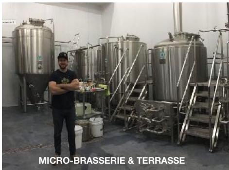
MICRO-BRASSERIE & TERRASSE